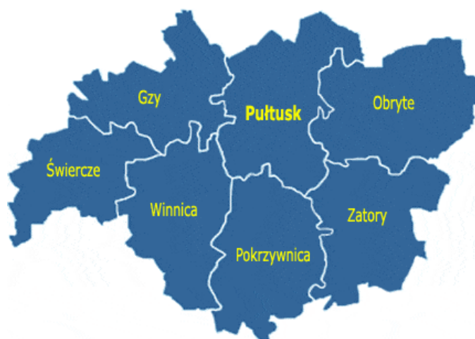
Rysunek 2. Gmina Świercze na tle powiatu pułtuskiego

Obszar jest zamieszkiwany przez 4650 osób ( stan na 31.12. 2020 r.). Gmina swoim zasięgiem obejmuje 28 sołectw. Graniczy z 5 gminami tj.: Gzy, Nasielsk, Nowe Miasto, Sońsk, Winnica.